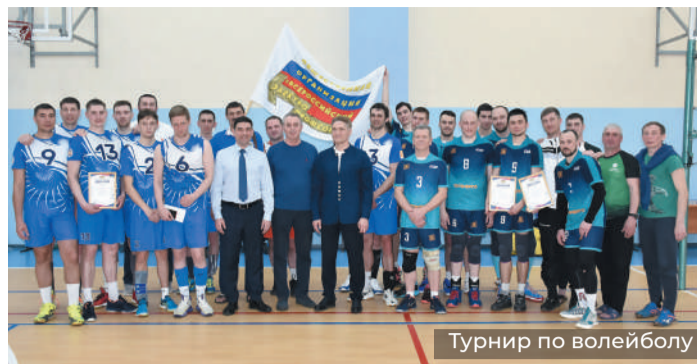
Турнир по волейболу