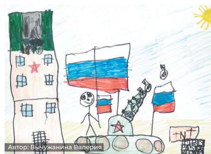
Автор: Вычужанина Валерия

Победители Республиканского конкурса детского рисунка, посвященного Дню Победы в Великой Отечественной войне.