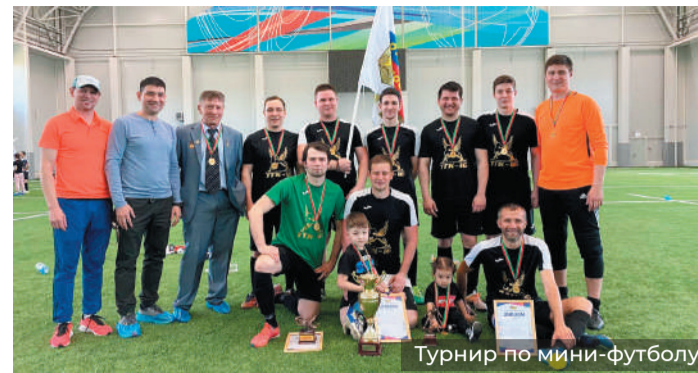
Турнир по мини-футболу