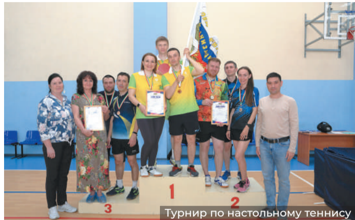
Турнир по настольному теннису