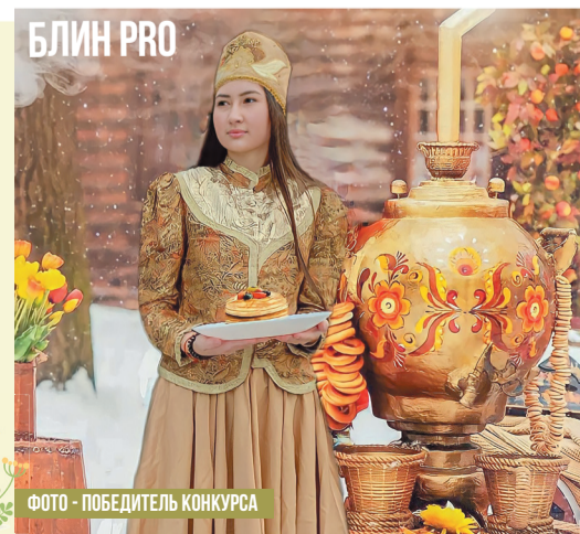
ФОТО - ПОБЕДИТЕЛЬ КОНКУРСА