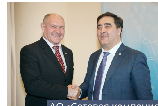
АО «Сетевая компания»