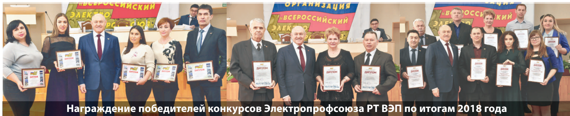
Награждение победителей конкурсов Электропрофсоюза РТ ВЭП по итогам 2018 года