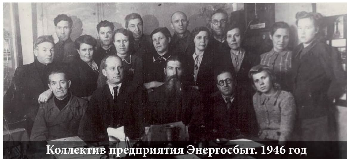
Коллектив предприятия Энергосбыт. 1946 год