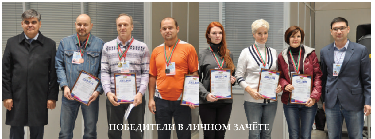
ПОБЕДИТЕЛИ В ЛИЧНОМ ЗАЧЁТЕ